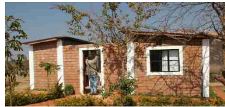
So werden die Häuser in Chamkoroma aussehen

z. B. der Bau von zwei Häusern in Chamkoroma für Ärzte und Krankenschwester, finanziert vom Dekanat (Pamita) und Marquartstein. Nach ausführlichen Gesprächen im August mit den Verantwortlichen vom DCMC