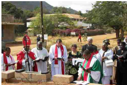
Grundsteinlegung in Mpwapwa

Die beiden größten Ereignisse der Reise im August, waren die Einweihung der Arusha-Road-Kirche in Dodoma und die Grundsteinlegung für die neue Kirche in Mpwapwa . Auch die Solarwerkstatt, CAPU und das neue