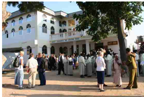
Die neue Kirche in Dodoma